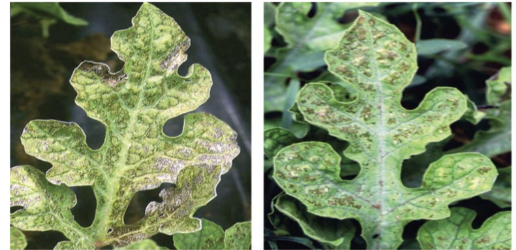
Daños de ozono en sandía

mente en los cultivos del área mediterránea. Es por esto, por lo que se hace cada vez mas necesario e imprescindible que los procesos de selección y mejora se realicen en las propias zonas de cultivo ya que de esta forma además de conocer el comportamiento frente a los posibles agentes patógenos y contaminantes atmosféricos permitiremos a los cultivos poner en marcha sus propios mecanismos de adaptación al tiempo que valoramos la importancia real de estas interacciones.