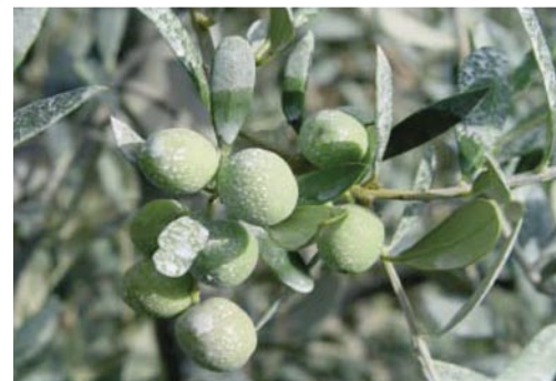
Las aplicaciones de caolines pueden servir para proteger las plantas de estrés como el sol, los vientos cálidos, etc., y para minimizar el ataque de plagas como la mosca del olivo.

Existen distintas formulaciones en el mercado a base de arcillas calcinadas y purificadas que reciben el nombre de caolín. En general tienen una buena protección contra insectos, golpes de sol y estrés térmicos. Existen en el mercado caolines registrados para el control de la mosca del olivo Bractocera oleae .