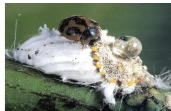
Rodolia cardinalis depredador de Cochinilla acanalada

Para la regulación de plagas exóticas, se utiliza una técnica denominada «introducción» de enemigos naturales o también llamado control biológico clásico. Este método incluye: identificación, importación y aclimatación de los enemigos naturales importados, con el fin de regular poblaciones de plagas introducidas en un país o región determinado. En los casos exitosos, esta forma de control ha servido para controlar numerosas plagas de manera permanente de tal manera que no causen daños económicos a los cultivos.