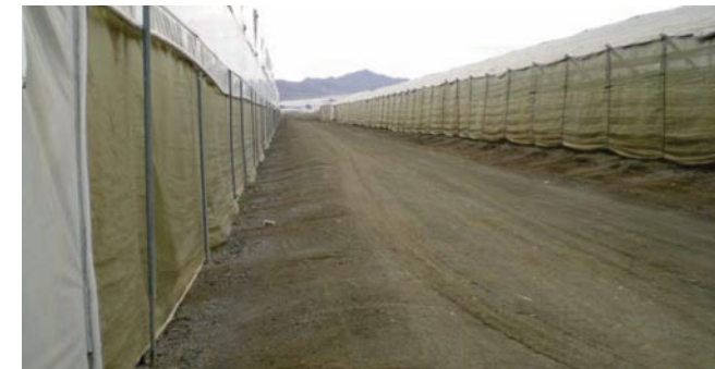
Protección contra insectos vectores con malla en invernaderos de Almería

▪ Mallas o tejidos de distinto trenzado con el fin de impedir la entrada de insectos a semilleros, invernaderos o cultivos al aire libre. En este sentido hay que advertir que los trenzados demasiado espesos pueden provocar problemas en los invernaderos por falta de ventilación, o en los cultivos al aire libre al impedir la polinización de insectos beneficiosos. Por otra parte la colocación de dobles puertas de mallas se ha mostrado como uno de los métodos más eficaces para el control de plagas y de insectos vectores de virosis.