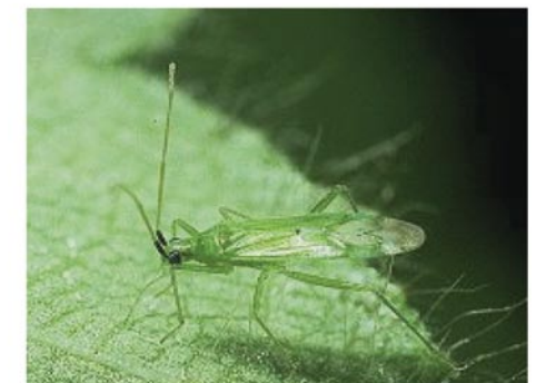
Los miridos, muy abundantes en los ambientes mediterráneos, son importantes depredadores de moscas blancas

Esta técnica consiste en aprovechar la capacidad que tenga un agro-sistema manipulándolo o no para que se favorezca la permanencia en el de los enemigos naturales ya presentes y así se pueda regular las poblaciones de plagas y mantenerlas a niveles bajos. La estrategia consiste en conservar y activar la presencia, la supervivencia y la reproducción de los enemigos naturales nativos que están presentes en un cultivo, a fin de incrementar su impacto sobre las plagas. Las posibilidades de incrementar las poblaciones de artrópodos benéficos y de mejorar su comportamiento depredador y parasítico efectivo, son viables a través del manejo de setos, ribazos, cubiertas vegetales que les brinde