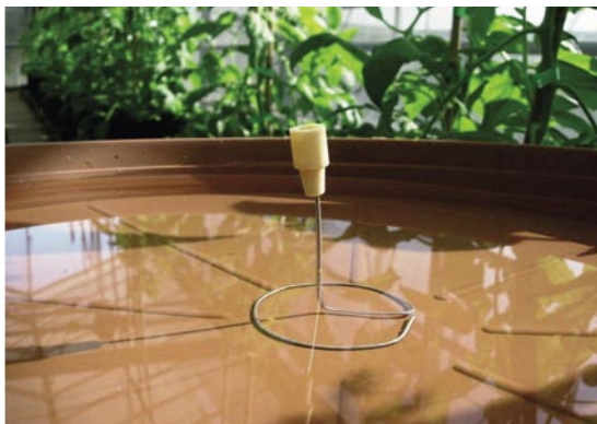
Trampa de agua con atrayente de feromona

A partir de recientes investigaciones existe la posibilidad de fabricar productos similares a las hormonas que emiten las hembras de los insectos y que sirve a los machos para orientarse en la búsqueda de las mismas. Existen distintos tipos de trampas en las que se coloca una cápsula de feromona de la especie que queremos monitorizar y de esa forma tendremos información sobre la presencia de machos.