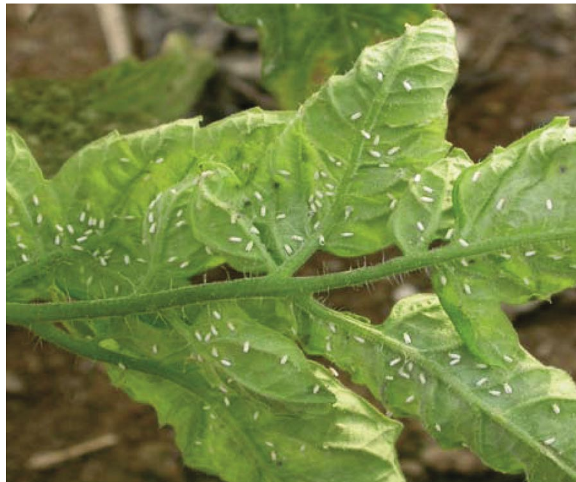
Ciertas plagas como las moscas blancas, cobran importancia, más que por los daños directos que puedan ocasionar, por ser vectores de virus

Por estas razones, al concentrarse los esfuerzos de los patólogos modernos en las fronteras de fragmentos más pequeños, (hongos, bacterias, virus, viroides, micoplasmas,...), se pierde de vista la presencia del entorno de las plantas, del suelo, del aire... como parte del propio paciente o de la propia enfermedad.