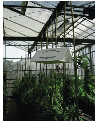
Trampa delta para el seguimiento de Tuta absoluta