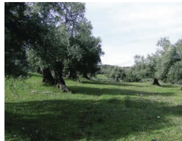
Las cubiertas vegetales son clave para el mantenimiento de la capacidad del suelo como filtro biológico de plagas.

En otros casos se ha podido establecer la relación del mantenimiento de cubierta vegetal con los problemas de ácaros. En efecto se ha comprobado que las cubiertas vegetales suelen mantener en general altas poblaciones de fitoseidos depredadores que en función de las condiciones ambientales ejercen una función reguladora se distintos tipos de ácaros bien sobre la propia cubierta o bien desplazándose hacia los cultivos.